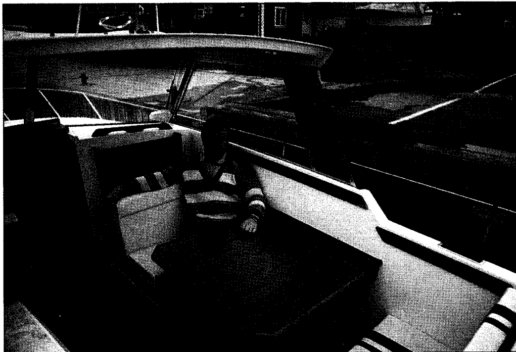
Precis som på 26:an kan passagerarsätet vändas och användas som sittplats vid matbordet. Bordet fälls upp från sidan.

Pentryts utrymmen är tillräckliga men kanske inte direkt generösa. Sätter man in pentryt i båtens totala funktion får man även här konstatera att det är väl avvägt och kommer säkert att